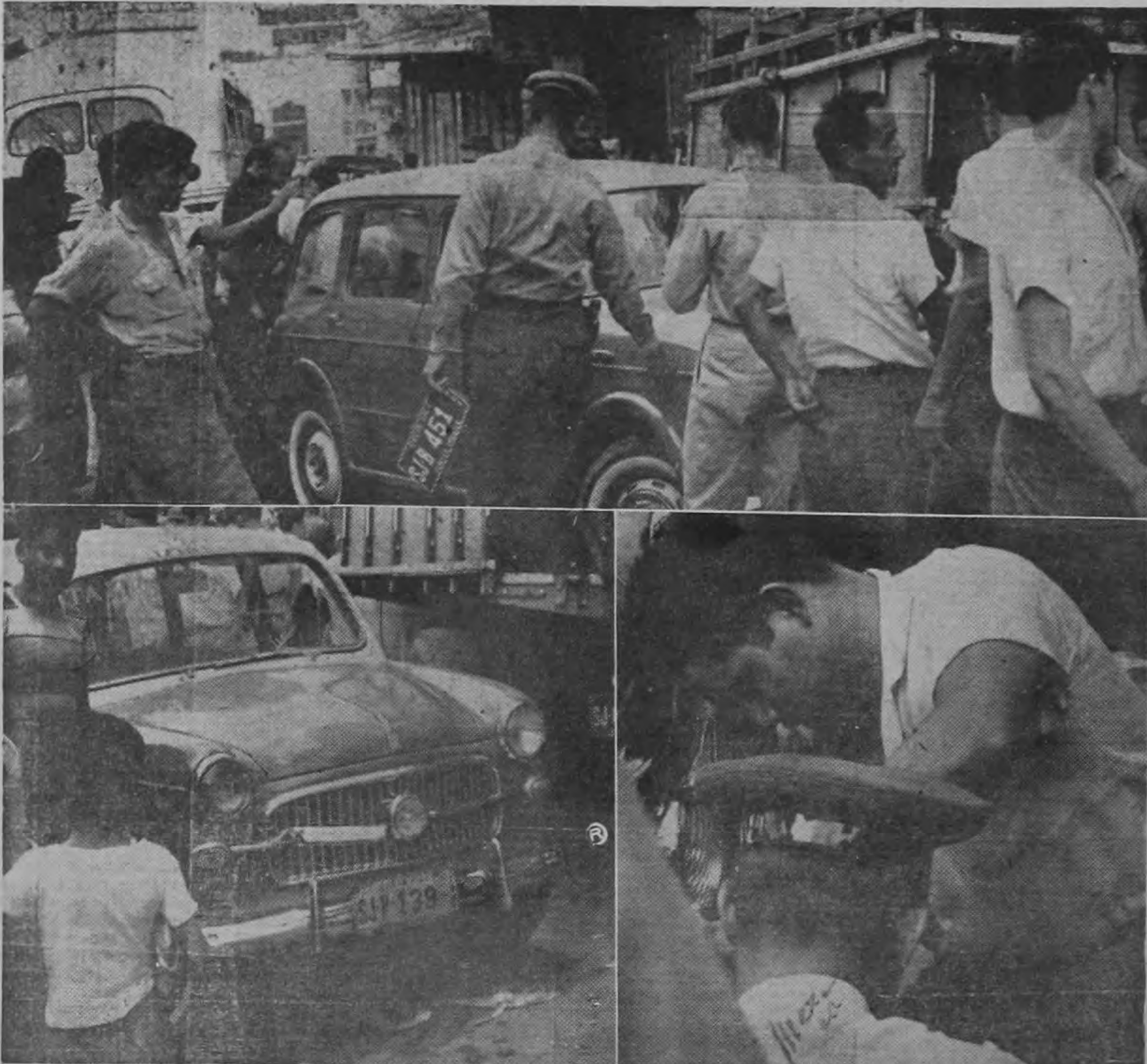
En la composición gráfica de MEZA, tres aspectos del accidente que pudo convertirse en una horrible tragedia. Arriba, el inspector de tránsito quita las placas al "milagroso" taxímetro en medio de gran cantidad de curiosos. En la parte de atrás el autobús. Abajo, izquierda, el taxi en cuestión, y a la derecha el inspector de tránsito y el conductor de la máquina a su lado.