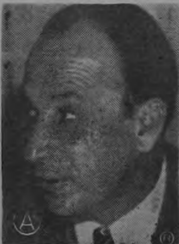
Don Francisco J. Orlich